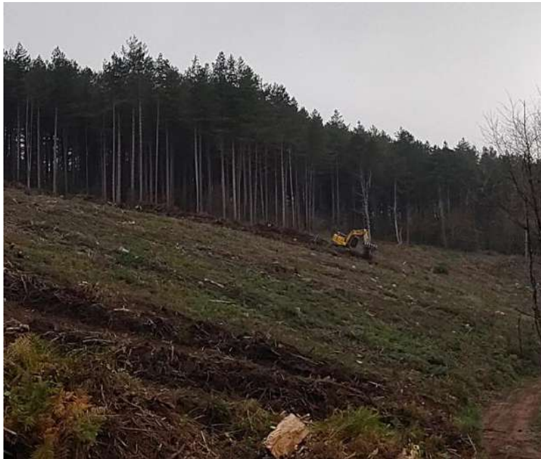
Mise en Andains